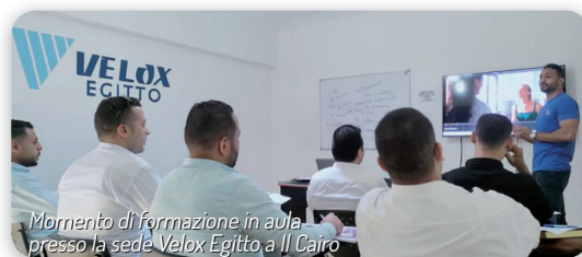
Momento di formazione in aula presso la sede Velox Egitto a Il Cairo

La recente apertura di un'accademia in Egitto, a Il Cairo, ha confermato che uno dei modi più efficaci per preparare il personale dell'accoglienza turistica all'eccellenza è attraverso l'istruzione formale. Programmi di formazione specialistica coprono una vasta gamma di argomenti, tra cui gestione alberghiera, servizio clienti, cucina e gestione delle risorse umane. Gli studenti acquisiscono competenze teoriche e pratiche in linea con le esigenze dell'industria turistica italiana, poi affinate nella struttura veronese. I programmi di studio sono progettati per essere flessibili, consentendo agli studenti di acquisire competenze specifiche per diverse posizioni all'interno delle strutture alberghiere.