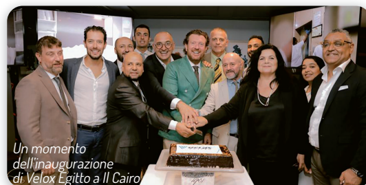
Un momento dell'inaugurazione di Velox Egitto a Il Cairo

Velox servizi , fondata a Verona nel 1990 da Gianmaria Villa, è un punto di riferimento a livello nazionale nell'ambito delle pulizie professionali. Gli elevati standard qualitativi, frutto di un aggiornamento continuo e dell'adozione delle più moderne tecnologie strumentali, consentono di gestire anche in maniera personalizzata e senza difficoltà grandi appalti e qualsiasi tipo di richiesta, avvalendosi di personale altamente qualificato. Velox è un'azienda certificata secondo i maggiori sistemi di qualità, per garantire la gestione dei processi con efficienza e la cura delle più stringenti normative.