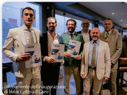
Un momento dell'inaugurazione di Velox Egitto a Il Cairo

La tecnologia sta rivoluzionando l'accoglienza turistica , dall'uso di dispositivi per la gestione del lavoro alla conoscenza di prodotti specifici. L'apprendimento in un ambiente controllato copre una vasta gamma di competenze , dalle app ai software specializzati, dai prodotti per la pulizia e la sanificazione alle interazioni con il pubblico. Questo aiuta i lavoratori a gestire in modo più efficiente le prenotazioni, il check-in e il check-out, il servizio in cucina e ai tavoli, così come la gestione delle aree comuni negli hotel.