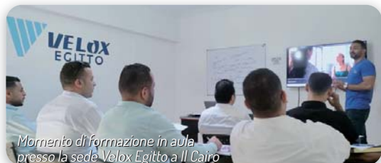
Momento di formazione in aula presso la sede Velox Egitto a Il Cairo

Per comprendere appieno le sfide e le difficoltà dei clienti, l'azienda veronese ha deciso di diventare proprietaria di un hotel, così da individuare anche le esigenze più specifiche e trovare soluzioni per soddisfarle, trasformando Muraless Art Hotel in una vera e propria accademia formativa alle porte di Verona. Un'iniziativa originale di cui beneficia sia Velox Servizi, rendendo l'azienda ancora più competitiva, sia il personale che gode di una maggiore sicurezza lavorativa grazie alla formazione ricevuta.